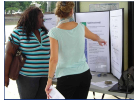
Personal del proyecto y ciudadano en el quiosco del Centro de Transferencia CCT

El personal del proyecto espera compartir los detalles de la Declaración SDEIS con el público y escuchar sus comentarios en las próximas sesiones abiertas informativas. ¡Por favor, hágase el propósito de asistir! Si no puede hacerlo, por favor visite las bibliotecas locales o la página electrónica del proyecto para repasar la SDEIS y hacer sus comentarios.