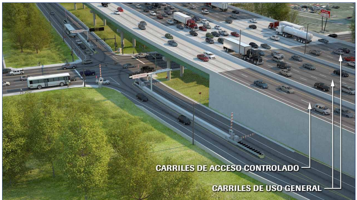
Cruce de carriles de acceso controlado en I-75 (al sur de I-575) – Simulación en dirección norte hacia Roswell Road

La SDEIS evalúa los impactos potenciales de una nueva alternativa del proyecto, la Alternativa de los Dos Carriles Reversibles, conocida también como la Alternativa de Construir (Build Alternative), y la compara con la Alternativa de No Construir (Non-Build Alternative), tal como lo establece el proceso ambiental.