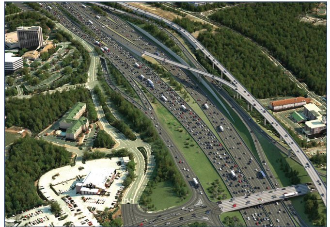
Representación artística de la vista aérea del sistema de carriles con acceso controlado en Windy Hill Road

Para dar a conocer los cambios en el esquema de financiamiento, responder preguntas y escuchar ideas y opiniones, el equipo del proyecto se pondrá en contacto con la comunidad a través de quioscos informativos ambulantes en centros comerciales, templos religiosos y reuniones de comisión del condado durante el verano. Contaremos con folletos,